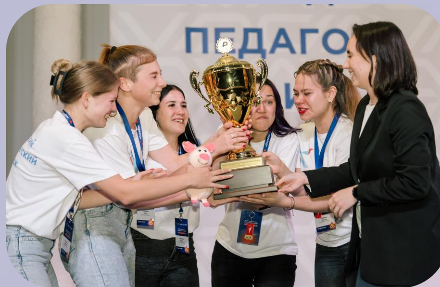
Педагогические отряды СПО

Конкурсный отбор будет реализован в формате образовательного курса, который включает в себя 3 блока для участников и советника. После изучения каждого образовательного блока участникам необходимо выполнить предложенные задания.